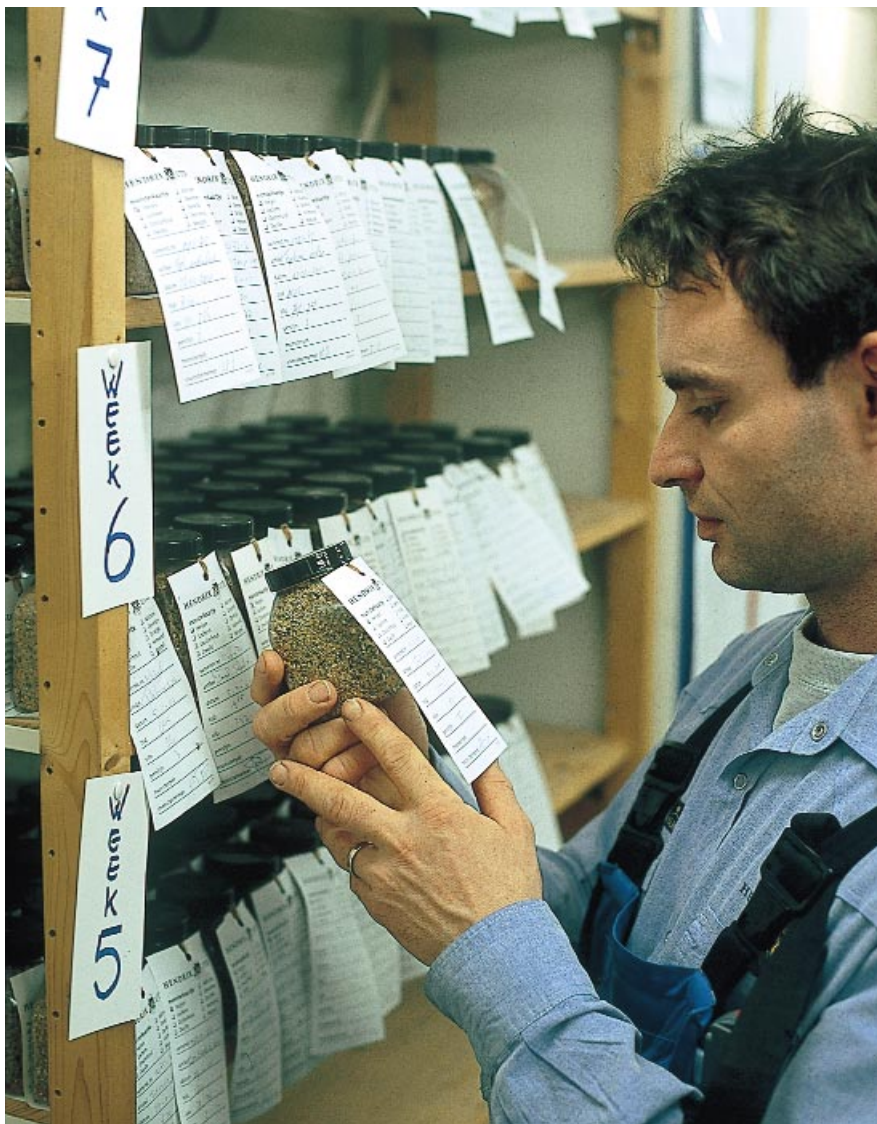
De uitvoeringsmogelijkheden van de certificatie en de monitoring worden verruimd