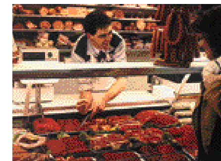
Uitgangspunt is de veiligheid van de levensmiddelen voor de consument

voor de sector opstellen waarvoor brede steun bestaat, zoals de GMP/HACCP-regeling voor de diervoedersector. Bovendien stemt het productschap het kwaliteitsbeleid af met de vervolgschakels in de dierlijke productieketen. Tevens organiseert het PDV ondersteunende activiteiten voor de diervoederbedrijven, zoals het initiëren en uitvoeren van risicoanalyses, uniformeren van voederwaardering (Centraal Veevoederbureau) en het houden van interlaboratoriumonderzoek (KDLL). Verder streeft het productschap naar internationale overeenstemming over de kwaliteitssystemen en -eisen aan diervoeders. Zo pleit het PDV voor Europese navolging van de met HACCP-principes uitgebreide Nederlandse GMP-kwaliteitsregeling voor de diervoedersector.