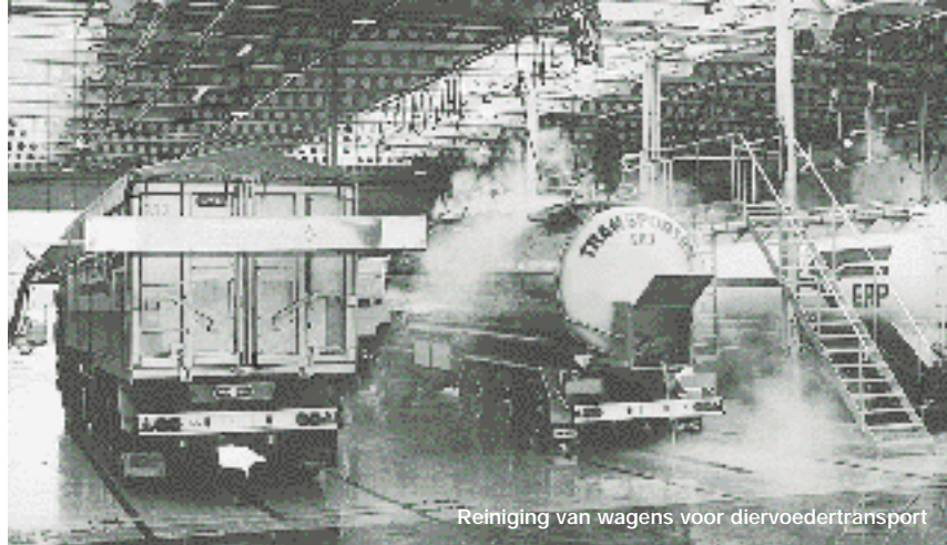
Reiniging van wagens voor diervoedertransport

van de opvolgend te vervoeren ladingen in bulk, dienen bepaalde basisprincipes voor reiniging en desinfectie te worden toegepast. Sommige ladingsvolgordes zijn vanwege te grote risico's van kruisbesmetting zelfs verboden.